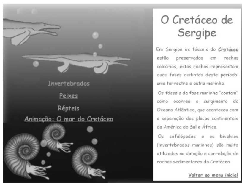
Figura 3. Página sobre o Cretáceo de Sergipe.

Em cada uma dessas partes (Invertebrados, peixes e répteis) há um texto explicativo e imagens com reconstituições dos animais mostrados na animação O Mar do Cretáceo . As figuras mostram a classificação taxonômica desses animais a nível de gênero.