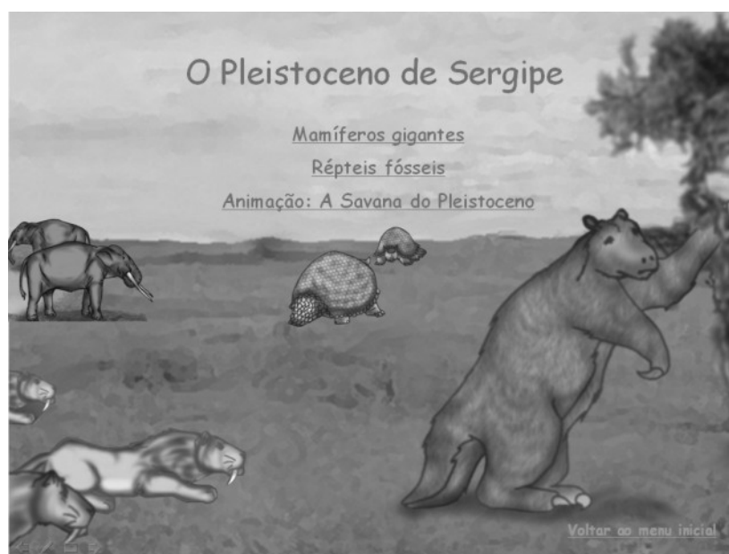
Figura 4. Página sobre O Pleistoceno de Sergipe.

A parte sobre os mamíferos fósseis exibe uma retrospectiva histórica sobre as pesquisas realizadas em Sergipe. Ao longo do texto estão dispostos links que contêm informações sobre: a época Pleistoceno , tanques (local onde são achados estes fósseis), e os mamíferos fósseis encontrados no Estado.