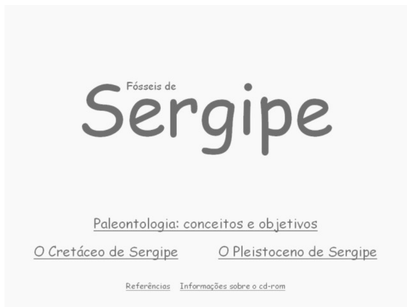
Figura 2. Tela de abertura do Cd-rom sobre os fósseis de Sergipe.